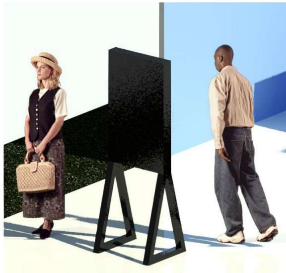
PERSPECTIVA ESC: 1 : 1