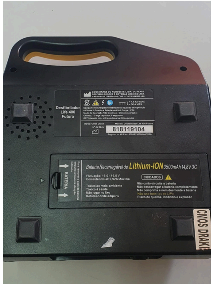
Marca/Modelo: CMOS DRAKE