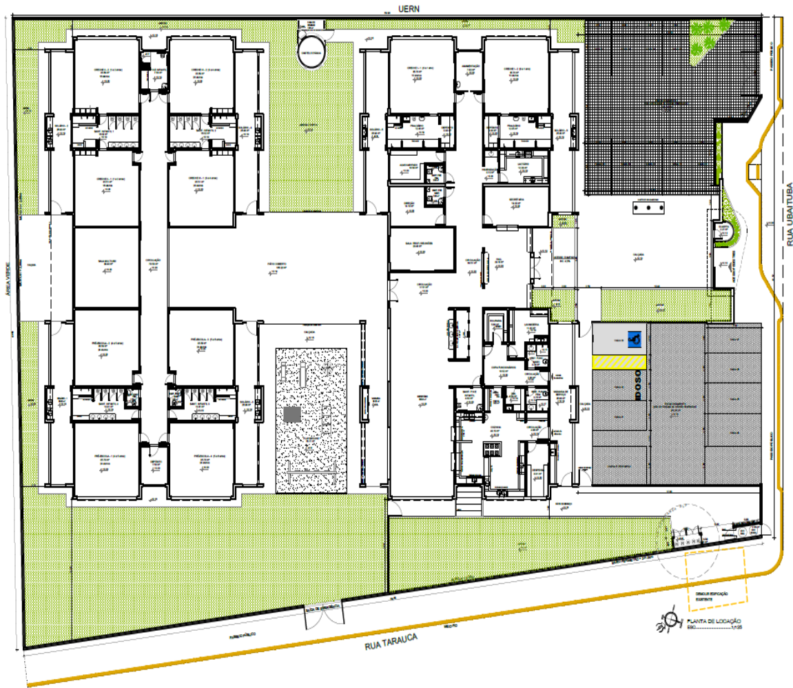
Imagem 02: Implantação com frente para a Rua Ubaituba.