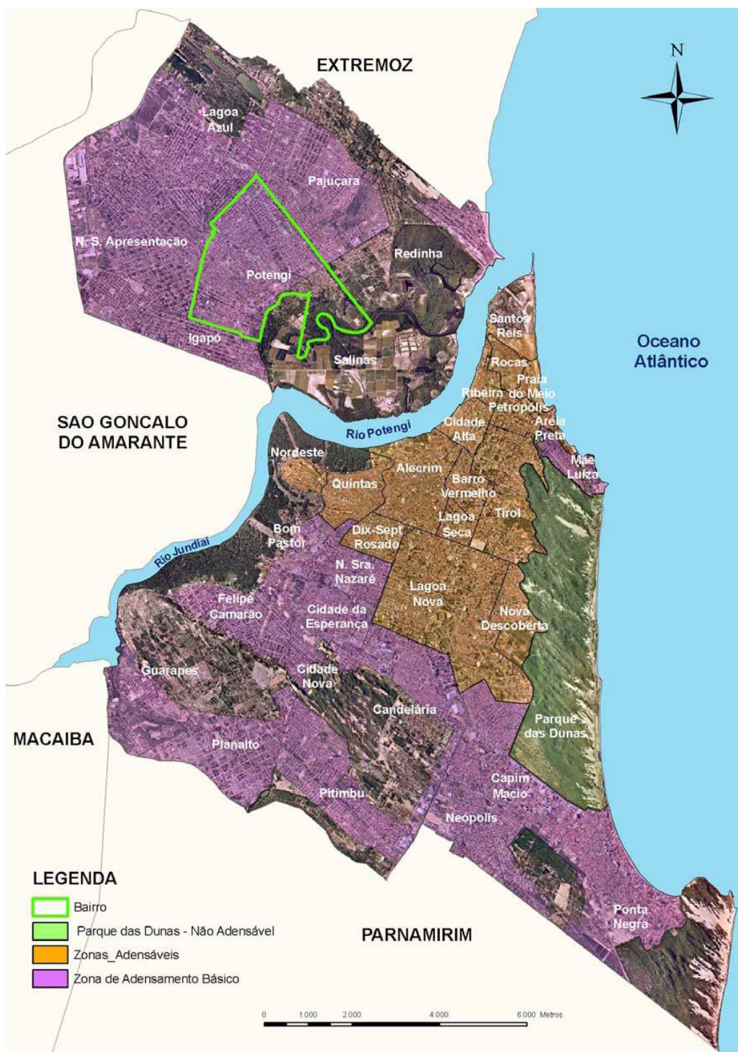
Imagem 01: Macrozoneamento