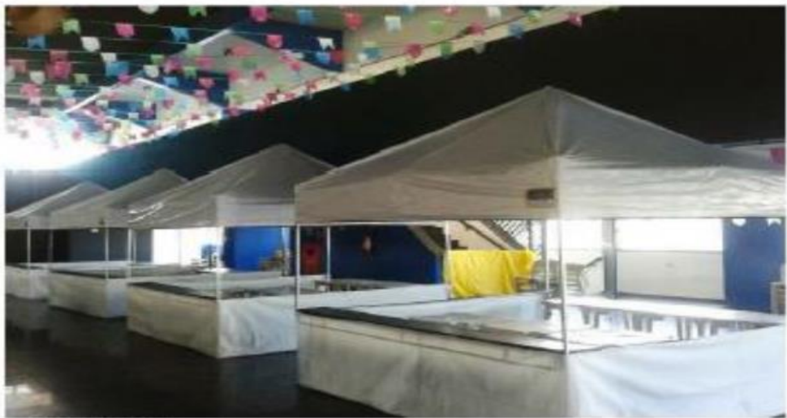
MODELO DE TENDA